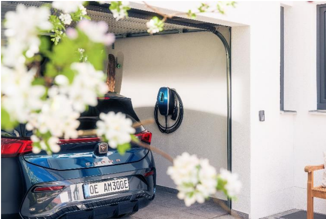
Die neue MENNEKES Wallboxfamilie AMTRON® 4You ist abgestimmt auf die individuellen Wünsche und Anforderungen der Nutzer